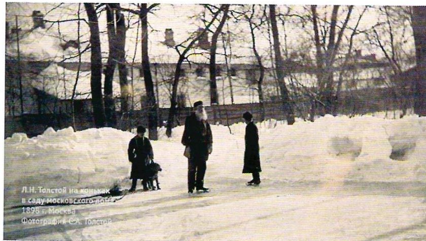
Л.Н. Толстой на коньках в саду московского дома 1898 г. Москва Фотография С.А. Толстой

Вся жизнь людская, можно сказать, состоит только из этих двух деятельностей: 1) приведения своей деятельности в согласие с совестью и 2) скрывания от себя