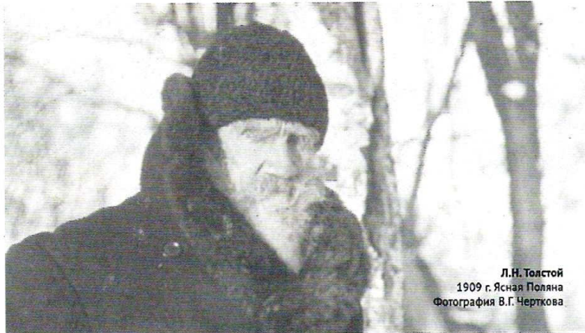
Л.Н. Толстой 1909 г. Ясная Поляна

мание от сознания разлада жизни с требованиями совести; сознание это мешает жить, и люди, чтобы иметь возможность жить, прибегают к несомненному внутреннему способу затемнения самой совести, состоящему в отравлении мозга одуряющими веществами.